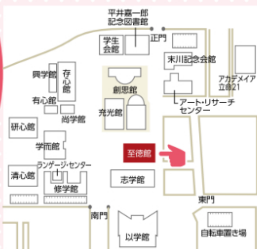
衣笠キャンパス 至徳館地下