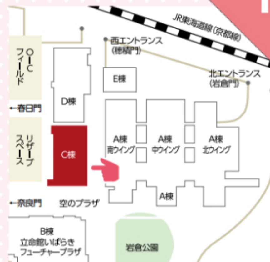
大阪いばらきキャンパス C棟1F OIC Shop付近