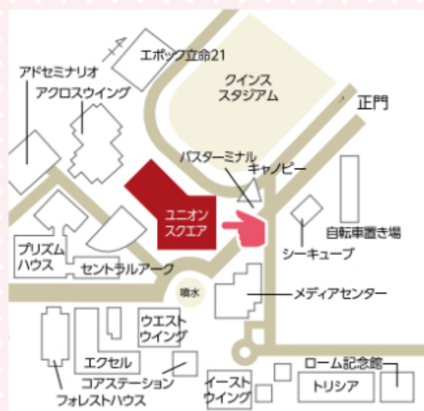
びわこ・くさつキャンパス ユニオンショップ前